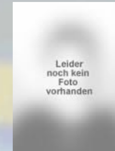
18 Davor Baric Leider noch kein Foto vorhanden