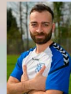
21 Leonardo Traetta