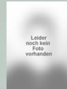
3 Ahmed Memić Leider noch kein Foto vorhanden