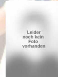
15 Mario Kozul Leider noch kein Foto vorhanden